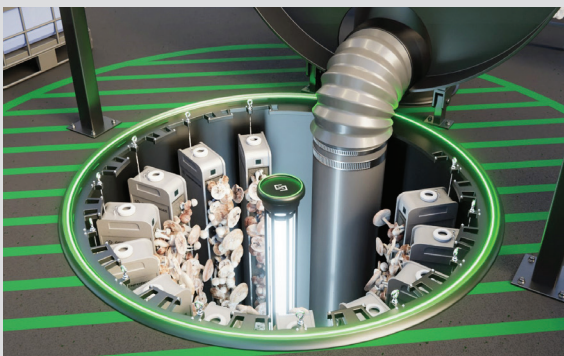
Simulation de Fungi Forge

« GreenForges ne pouvait pas creuser 50 trous pour tester ses systèmes. Nous avons donc aidé leur équipe à percer 50 trous dans un environnement virtuel à l'aide d'un logiciel et à examiner les performances mécaniques et thermiques ainsi que la distribution de l'air. GreenForges sera ensuite prête à creuser des trous, elle n'aura qu'à en percer quelques-uns, car la probabilité de réussite de la conception sera beaucoup plus élevée grâce au prototypage virtuel. »